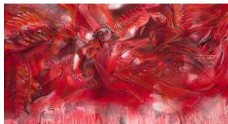
Arthur Suusman: Kick at the darkness till it bleeds daylight

Aanmelden kan via onze website: https://www.oecumenischplatformnh.nl/contact of email info@oecumenischplatformnh.nl . Onder nieuwberichten vindt u het uitgebreide programma.